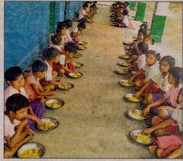
अनगड़ा के नवागढ़ स्कूल में सोमवार को मध्याह्न भोजन करते बच्चे।

रांची के स्कूलों में अधिकांश स्कूलों में मध्याह्न भोजन या तो उधार के भरोसे चल रहा है या शिक्षकों के पैसे से चल रहा है। सरकार द्वारा तय किए गए मेन्यू के अनुसार स्कूल मध्याह्न भोजन परोसने में नाकाम हो रहे हैं। शिक्षकों का कहना है कि दुकानदारों से उधार मांगा जा रहा है। जब उधार अधिक हो जाता है तो जेब से राशि का भुगतान करना पड़ता है।